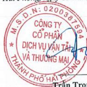
Trần Trọng Tâm